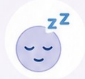
3. Sous anesthésie locale ou générale selon le cas