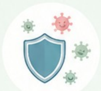
Otites à répétition