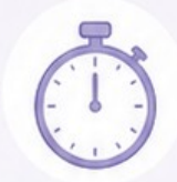
4. Intervention rapide