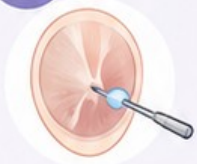
1. Petite ouverture du tympan