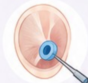
2. Mise en place du tube